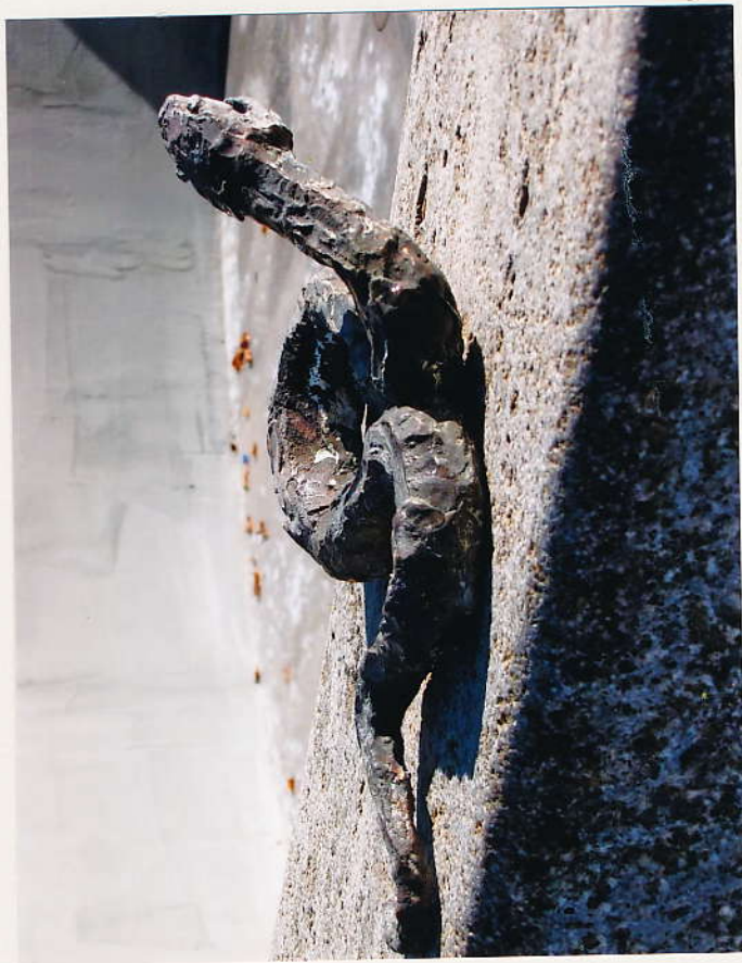
Marktbrunnen, Bronze, Muschelkalk Hildegardplatz Kempten, 2013 Trinkwasserspeier am Beckenrand