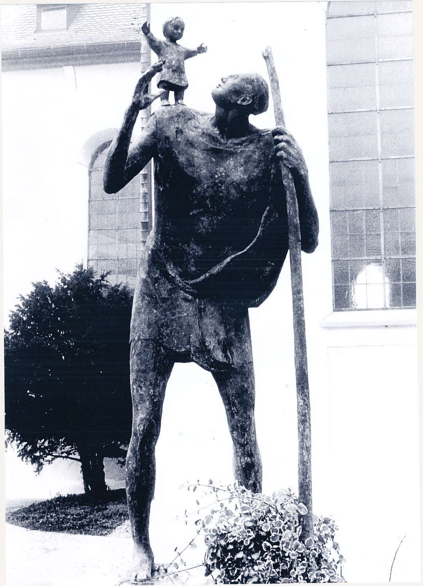
Christopherus, Bronze Marktplatz Wiggensbach, 2000