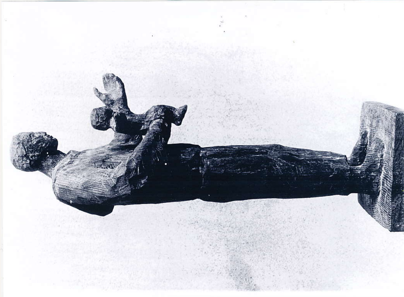
Antonius, Eiche Kirche St. Wolfgang, Meitingen, 2003