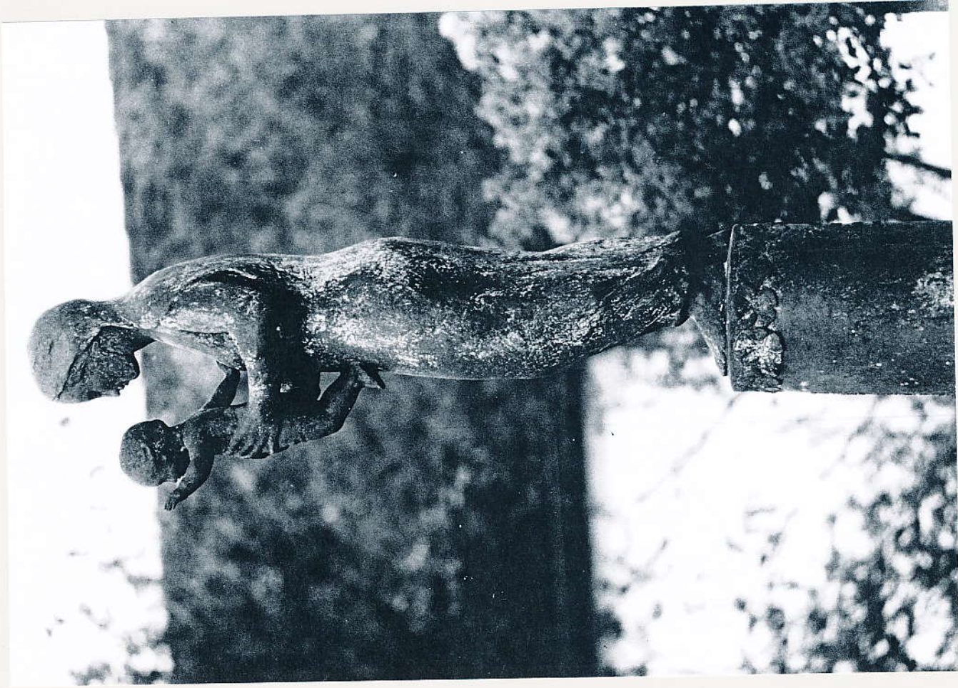
Mariensäule, Bronze Liebfrauenkirche Bobingen, 2001