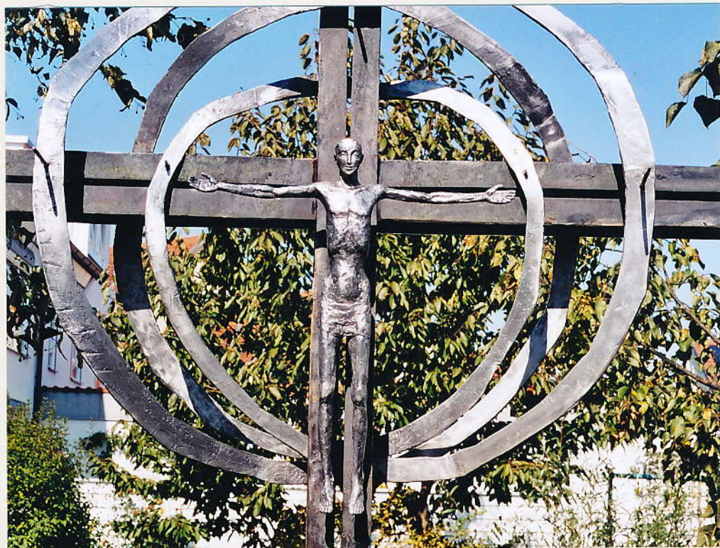
Kreuz, Bronze, Aluminium St.Ulrich, Dillingen, 2002