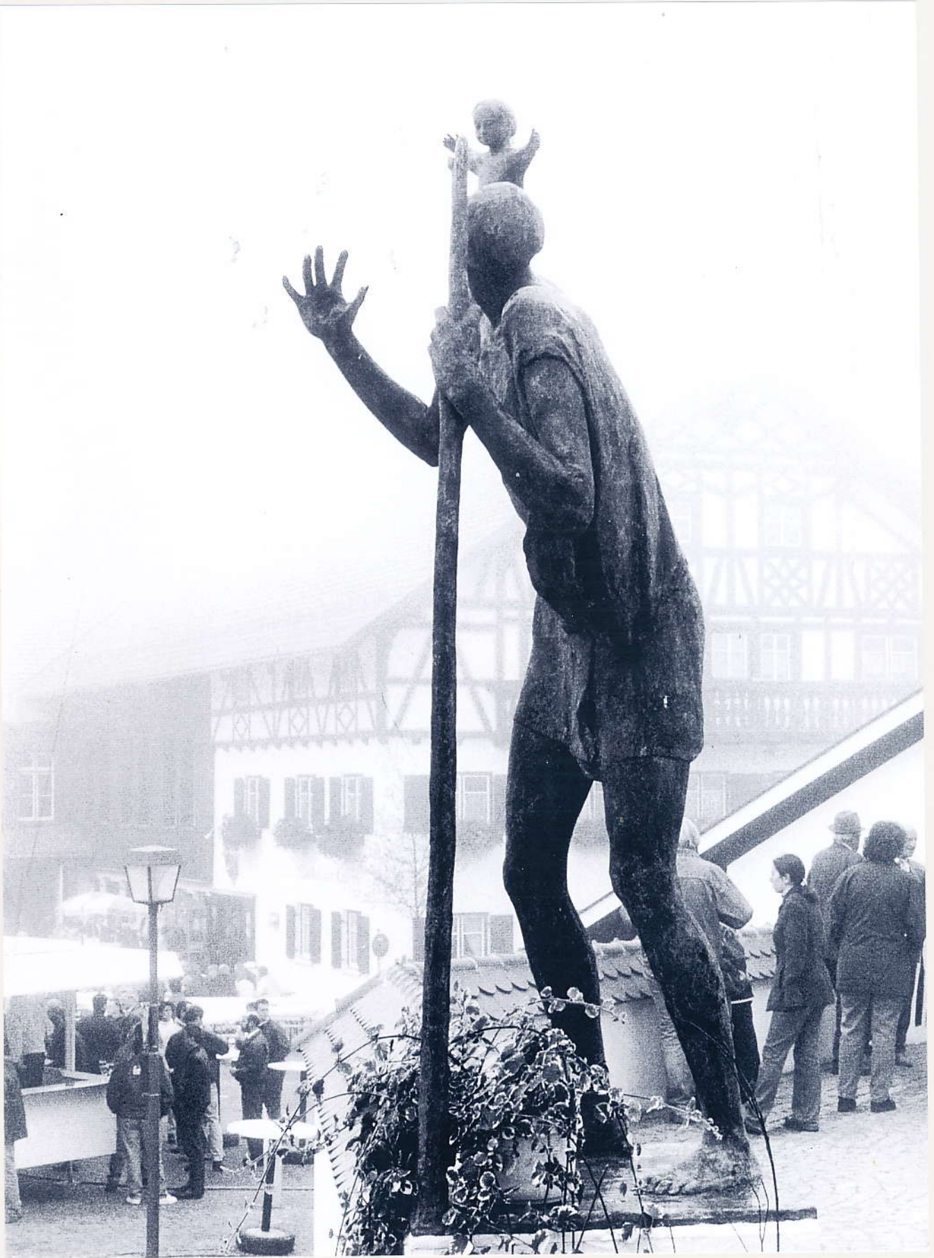
Christopherus, Bronze Marktplatz Wiggensbach, 2000