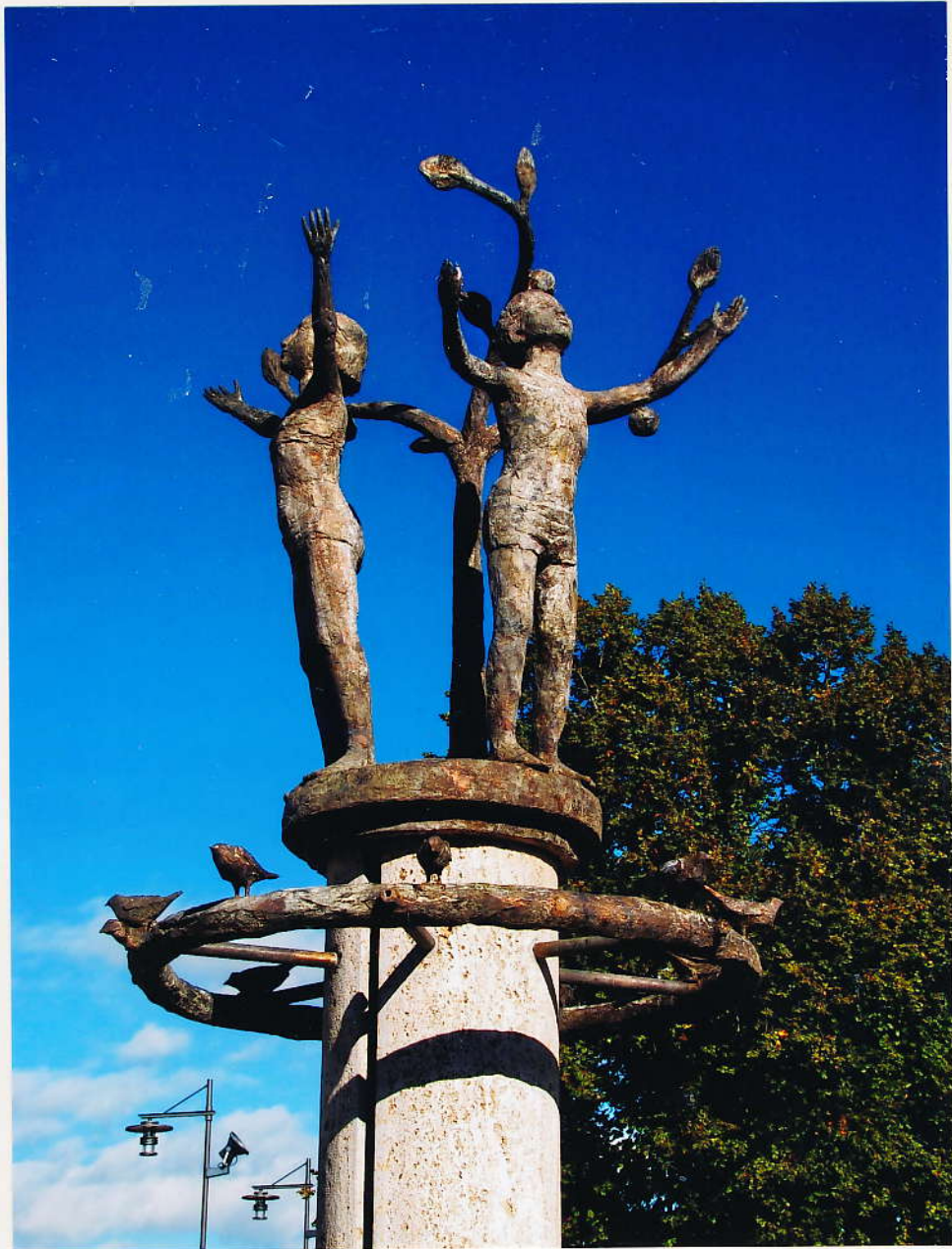
Marktbrunnen, Bronze, Muschelkalk Hildegardplatz Kempten, 2013